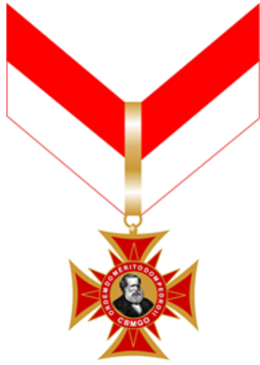
Figura 3: Medalha Grande-Oficial anverso