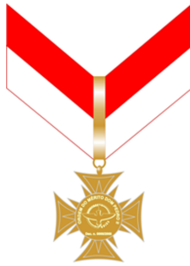
Figura 4: Medalha Grande-Oficial reverso