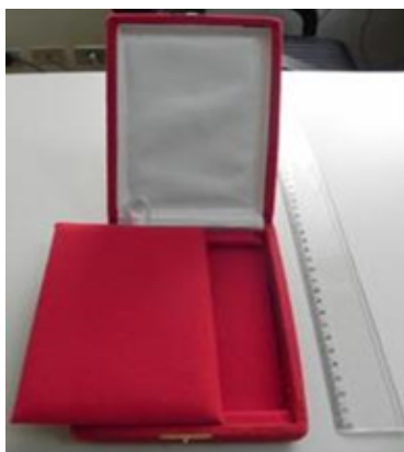
Figura 9: Estojo