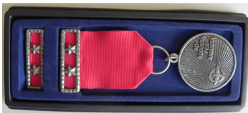
Figura 16: Estojo para Medalha de Tempo de Serviço – Gradação Ouro, Prata e Bronze