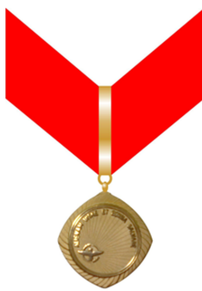
Figura 8: Medalha Comendador - reverso