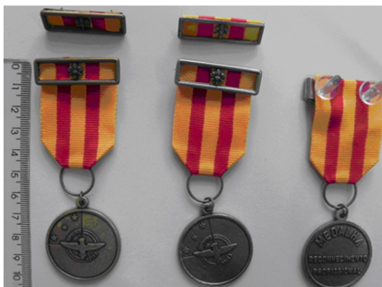
Figura 14: Medalha de Reconhecimento Profissional – Gradação Ouro, Prata e Bronze

4.3 Estojo: Estojo retangular plástico próprio para medalhas, com encaixe em baixo relevo aveludado para acondicionamento da medalha e do passador. (conforme figura ilustrativa 16)