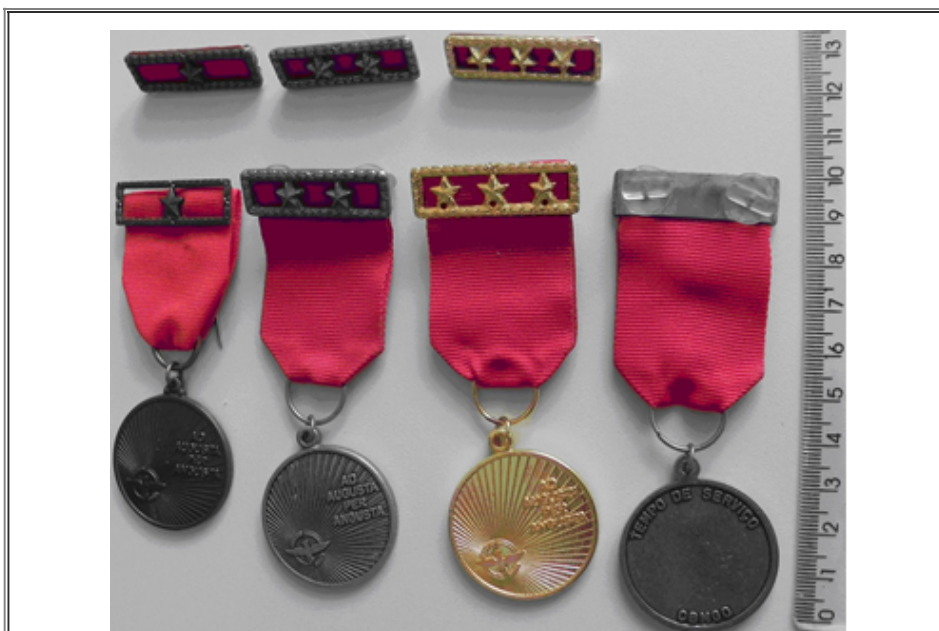
Figura 15: Medalha de Tempo de Serviço – Gradação Ouro, Prata e Bronze

5.3 Estojo: Estojo retangular plástico próprio para medalhas, com encaixe em baixo relevo aveludado para acondicionamento da medalha e do passador. (conforme figura ilustrativa 16)