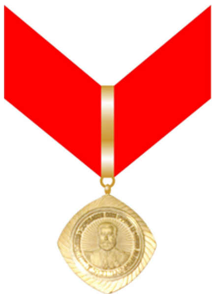
Figura 7: Medalha Comendador - anverso