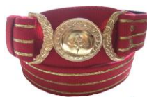
Figura 4- Cinto

1.4. CINTO ESPECIAL DE PASSEIO (art. 21, II Dec. 7.005 de 30 de setembro de 2009). Confeccionado em couro na cor vermelha, Tamanho: sob medida. Faixas contendo três fios dourados ao longo do cinto, fivela dourada (figura 41, anexo do Dec. 7.005 de 30 de setembro de 2009).