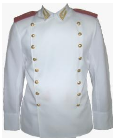
Figura 2- Túnica Branca

na cor dourada, botões dourados dispostos em duas fileiras longitudinais, passadores aplicados sobre as costuras dos ombros (dois simples), do mesmo tecido da túnica, em que serão afixadas as platinas e dois (passadores) nas costas, na região lombar para facilitar a aplicação do cinto. (figura 16, anexo do Dec. 7.005 de 30 de setembro de 2009). As túnicas deverão ser confeccionadas sob medida , sendo esta, recolhida pela licitante vencedora para confecção do fardamento.