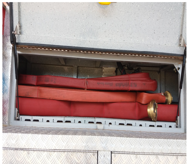
Imagem 20 - Compartimento traseiro