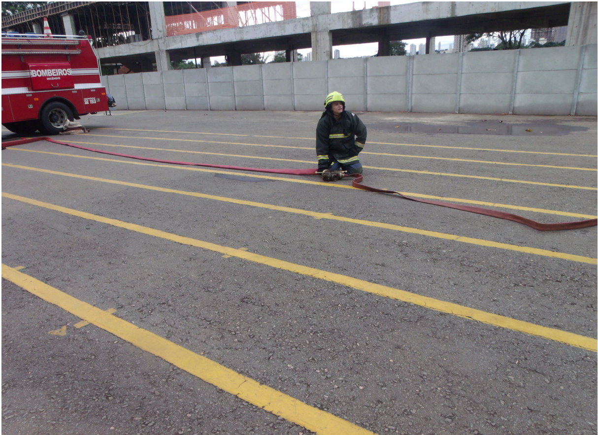
Imagem 15 - Montagem de linha de combate