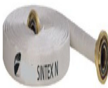
Imagem 5 - Mangueira tipo 2