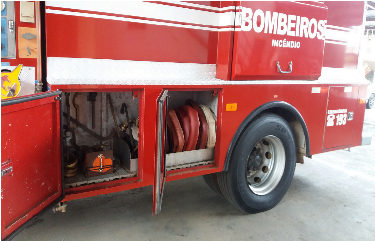
Imagem 3 - Compartimento com as mangueiras aduchadas