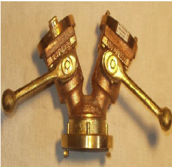
Imagem 2 - Divisor com duas expedições