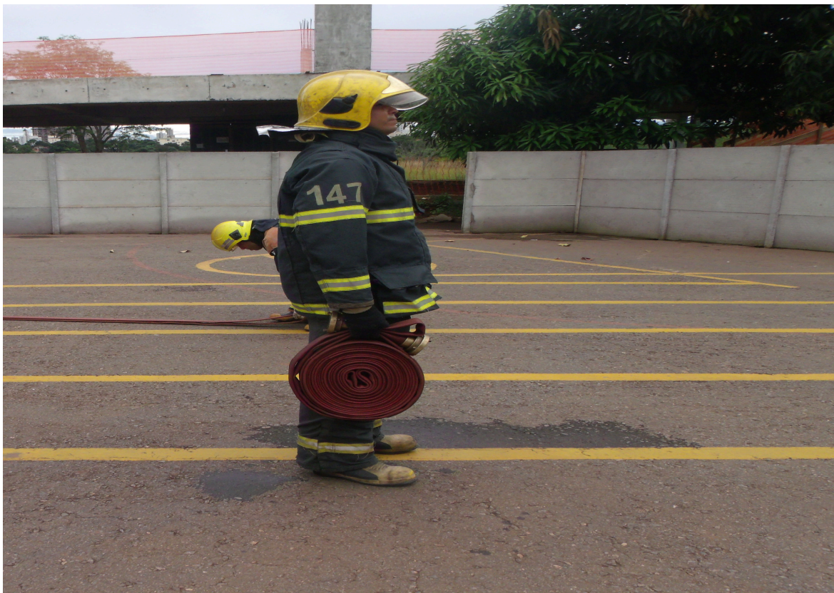
Imagem 10 - Militar transportando as mangueiras segurando-as em garras