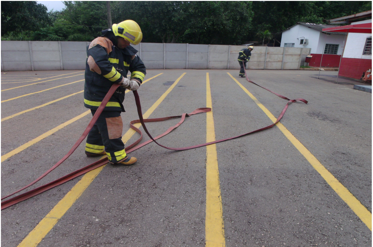
Imagem 7 - Guarnição na montagem da linha de combate