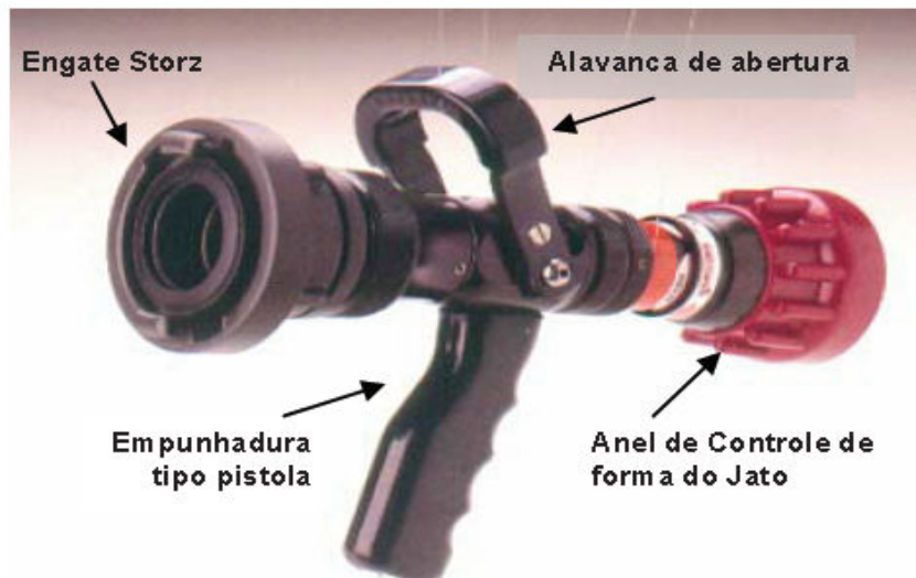
Imagem 1 - Esguicho tipo pistola com vazão regulável

importância conhecer este equipamento de combate em detalhes, para usufruir de forma consciente de todos os seus recursos (CORPO DE BOMBEIROS MILITAR DO ESTADO DO RIO DE JANEIRO, 2014).