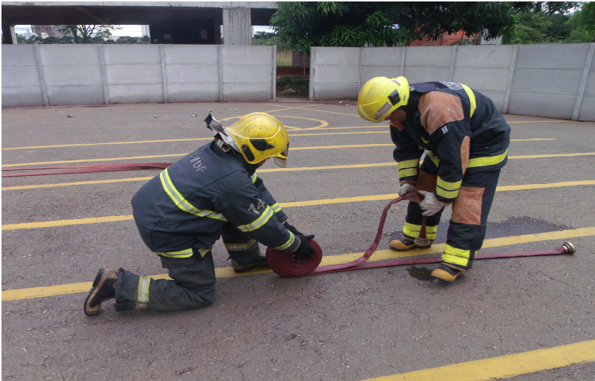
Imagem 9 - Militares acondicionando as mangueiras de forma aduchada