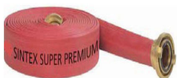
Imagem 8 - Mangueira tipo 5