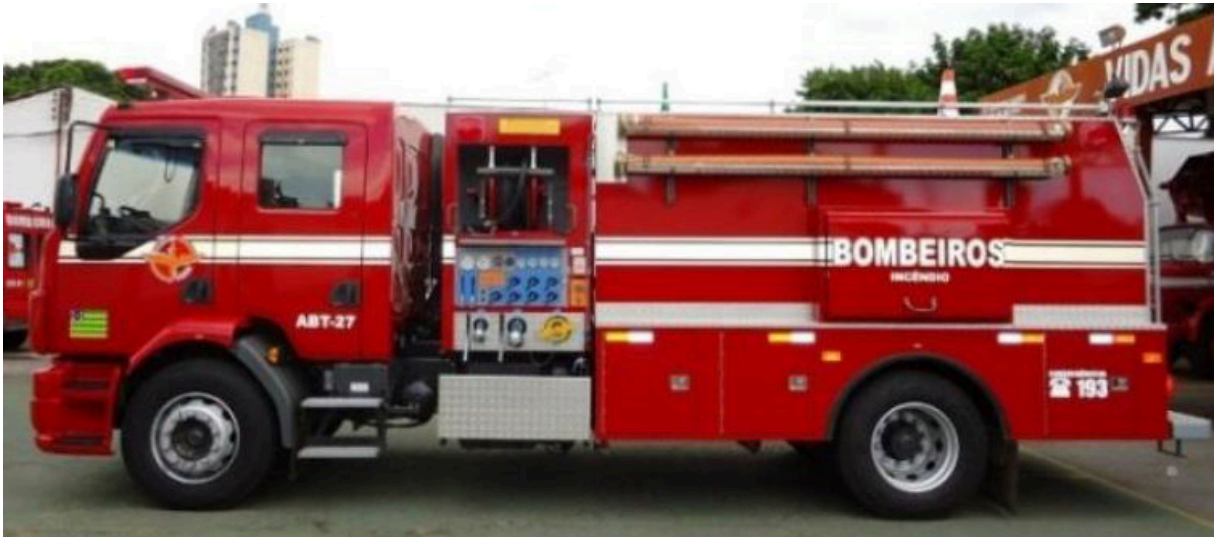
Imagem 15 – Modelo de ABT mais utilizado pelo CBMGO Fonte: GOIÁS (2013)

exclusivamente para este método de acondicionamento, destinados a acomodar separadamente cada material de estabelecimento, proporcionando maior comodidade e organização a esses equipamentos.