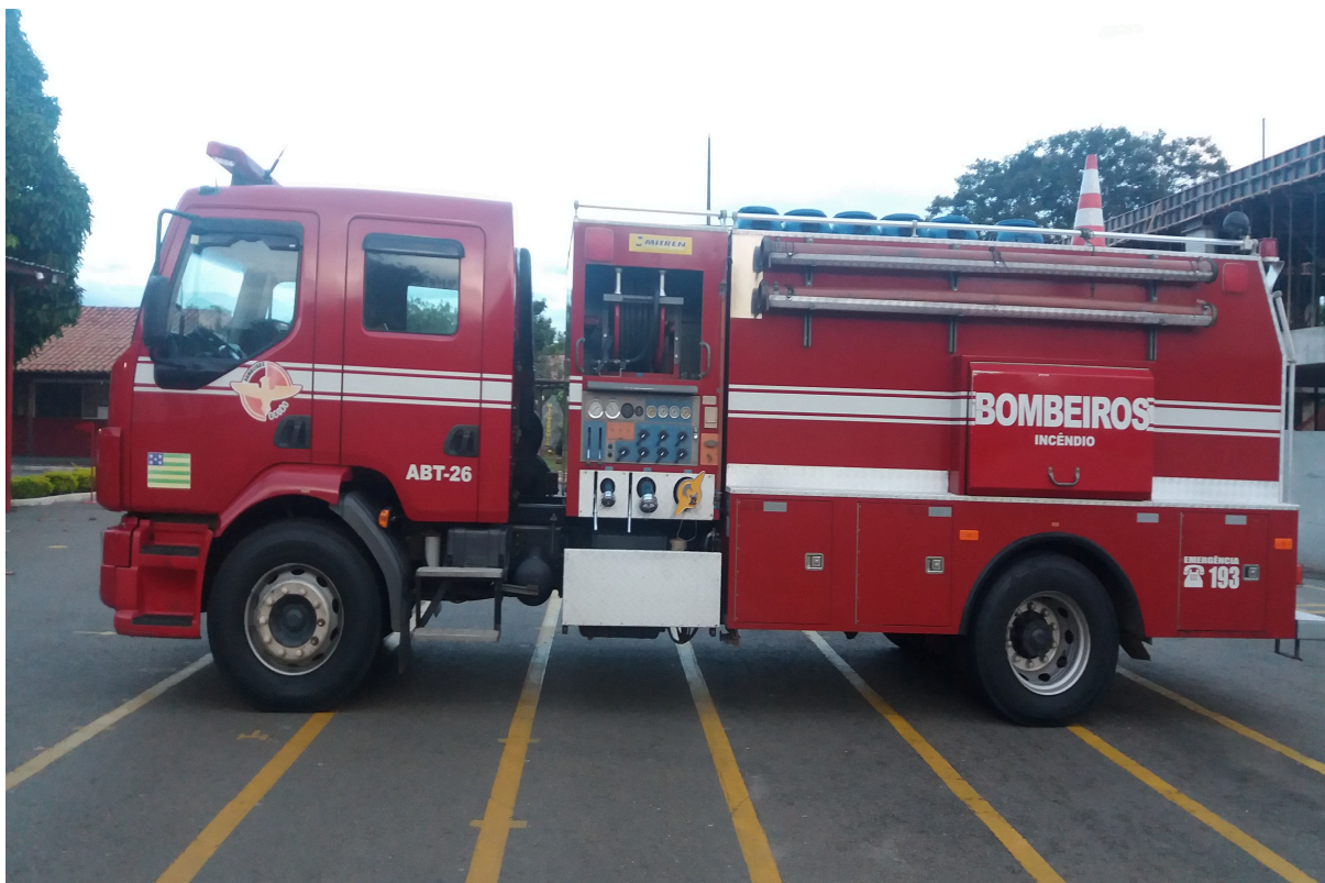
Imagem 1 - ABT-26 onde foram realizados os testes

Apêndice A: Fotos dos testes aplicados na montagem das linhas de combate.