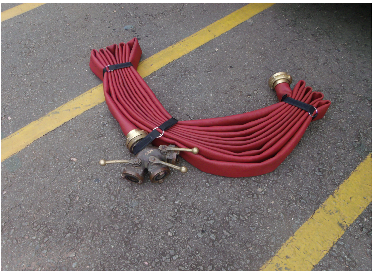
Imagem 12 - Linha pré-montada acondicionada em ziguezague