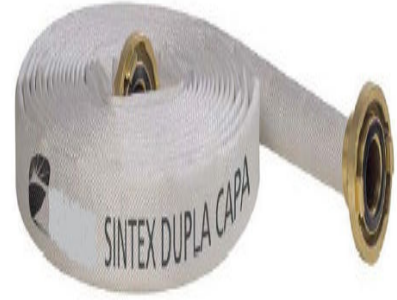
Imagem 6 - Mangueira tipo 3