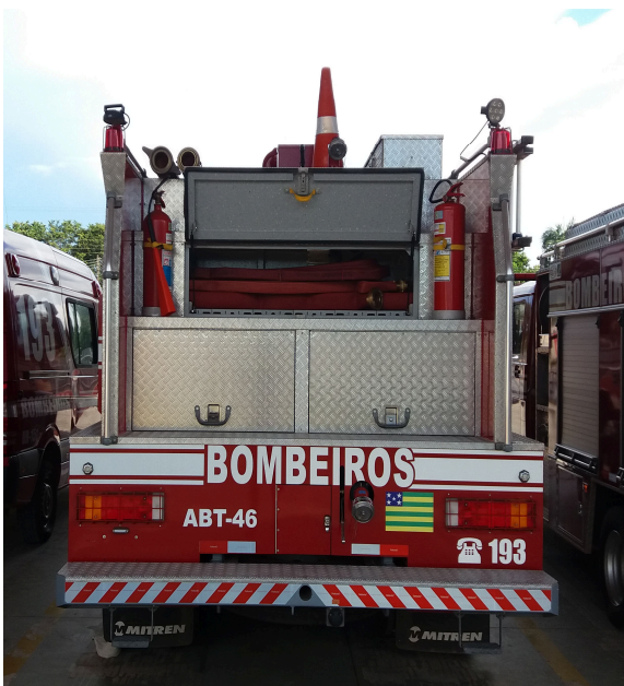
Imagem 19 - ABT – 5ª CIBM