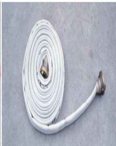
Imagem 10 - Em espiral