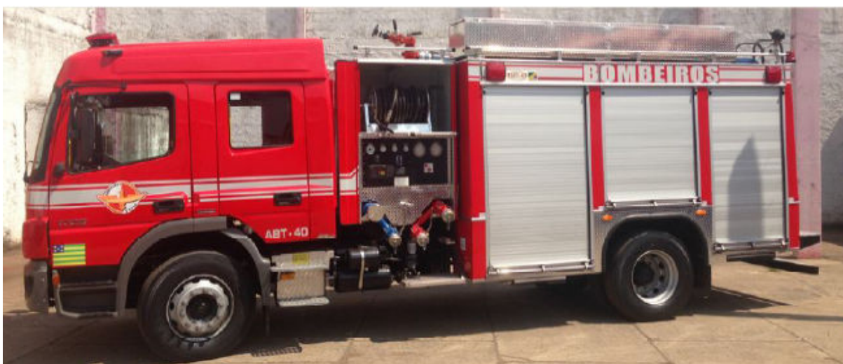
Imagem 16 - Auto bomba tanque e salvamento com compartimentos maiores

Desta forma, nota-se que os compartimentos que envolvem o tanque, responsáveis pelo acondicionamento de materiais, encontram-se dispostos de maneira que otimizem as seções da viatura, e preenchem todo o espaço que vai da base até a extensão superior do chassi possuindo, portas do tipo persiana que abrem no sentido vertical enrolando para cima, conforme mostra a Imagem 16.