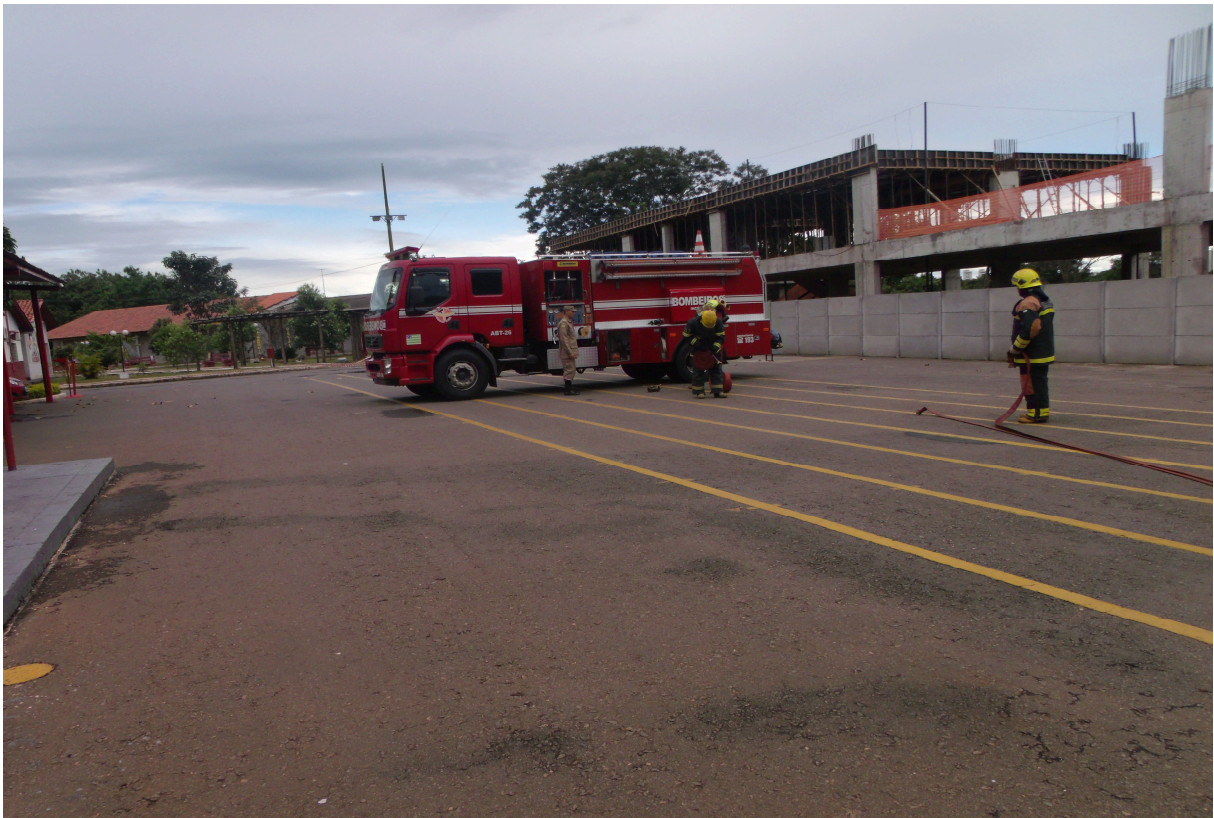
Imagem 4 - Guarnição na montagem da linha de combate com mangueiras aduchadas