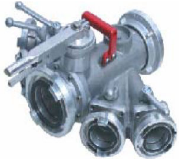
Imagem 3 - Divisor com cinco expedições