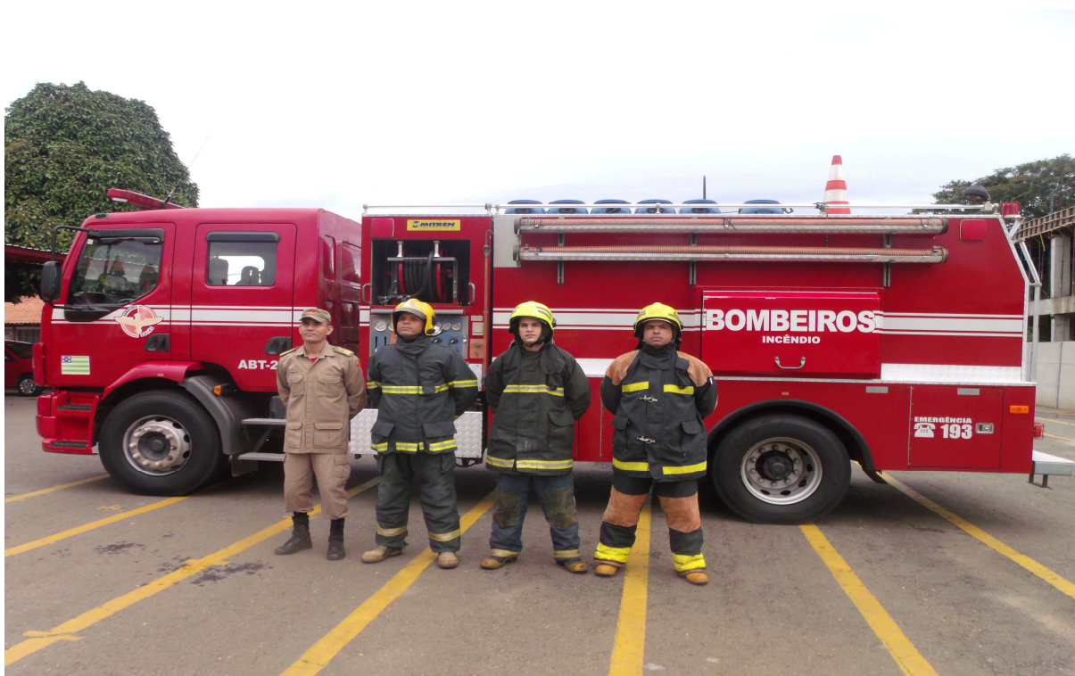
Imagem 2 - Guarnição reduzida que realizou os testes