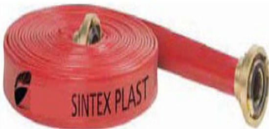
Imagem 7 - Mangueira tipo 4