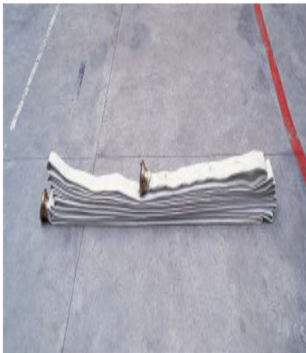
Imagem 9 - Em ziguezague

A forma de transporte das mangueiras acondicionadas em ziguezague deve ser feita colocando seu centro sobre os ombros, podendo o esguicho estar previamente acoplado, com sua junta de união por baixo e junto aos ombros, estando à frente do bombeiro enquanto faz a progressão e a outra junta voltada para trás (CORPO DE BOMBEIROS MILITAR DE MINAS GERAIS - CBMMG, 201-).