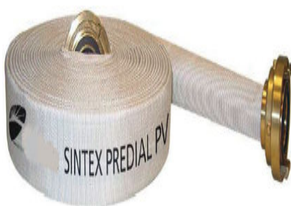
Imagem 4 - Mangueira tipo 1

Comumente utiliza-se para o combate a incêndios mangueiras com diâmetros de 38 mm ou 1 ½” (uma e meia polegada) e 63 mm ou 2 ½” (duas e meia polegada) com juntas de união de engate rápido do tipo storz , como mostra as Imagens abaixo, pois permitem o acoplamento e desacoplamento rápido das mangueiras entre si e entre os outros equipamentos destinados ao combate (CORPO DE BOMBEIROS MILITAR DE SANTA CATARINA - CBMSC, 2013).