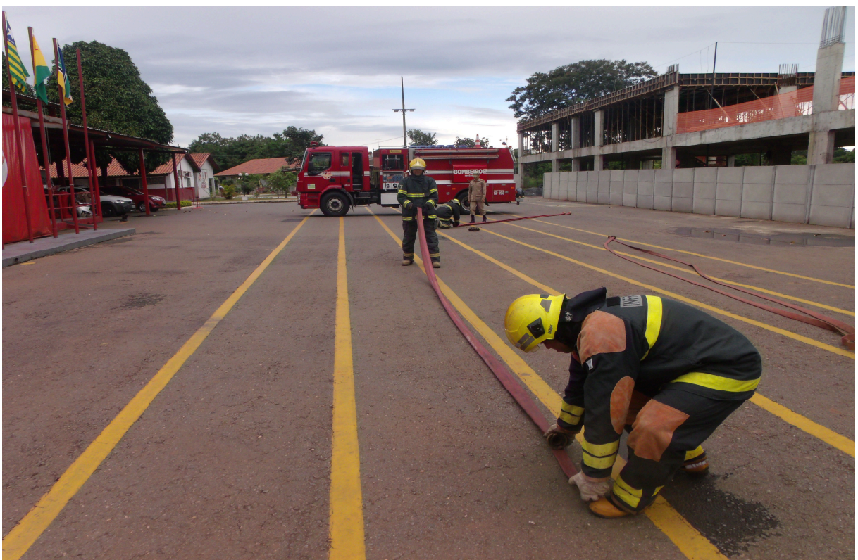
Imagem 8 - Militares acondicionando as mangueiras de forma aduchada