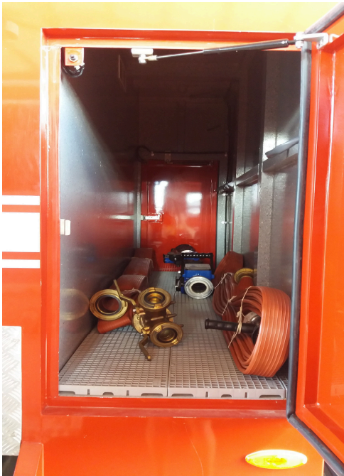
Imagem 17 - Compartimento lateral

Na referida companhia, as guarnições de combate a incêndio já fazem a utilização de linhas prontas em seu auto bomba tanque, conforme podemos observar nas Imagens abaixo que mostram tal processo.