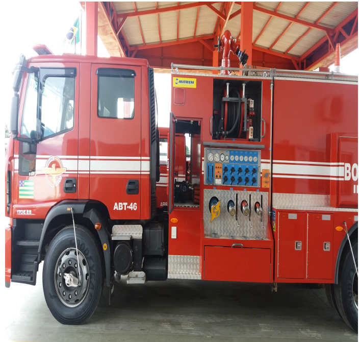
Imagem 18 - ABT – 5ª CIBM