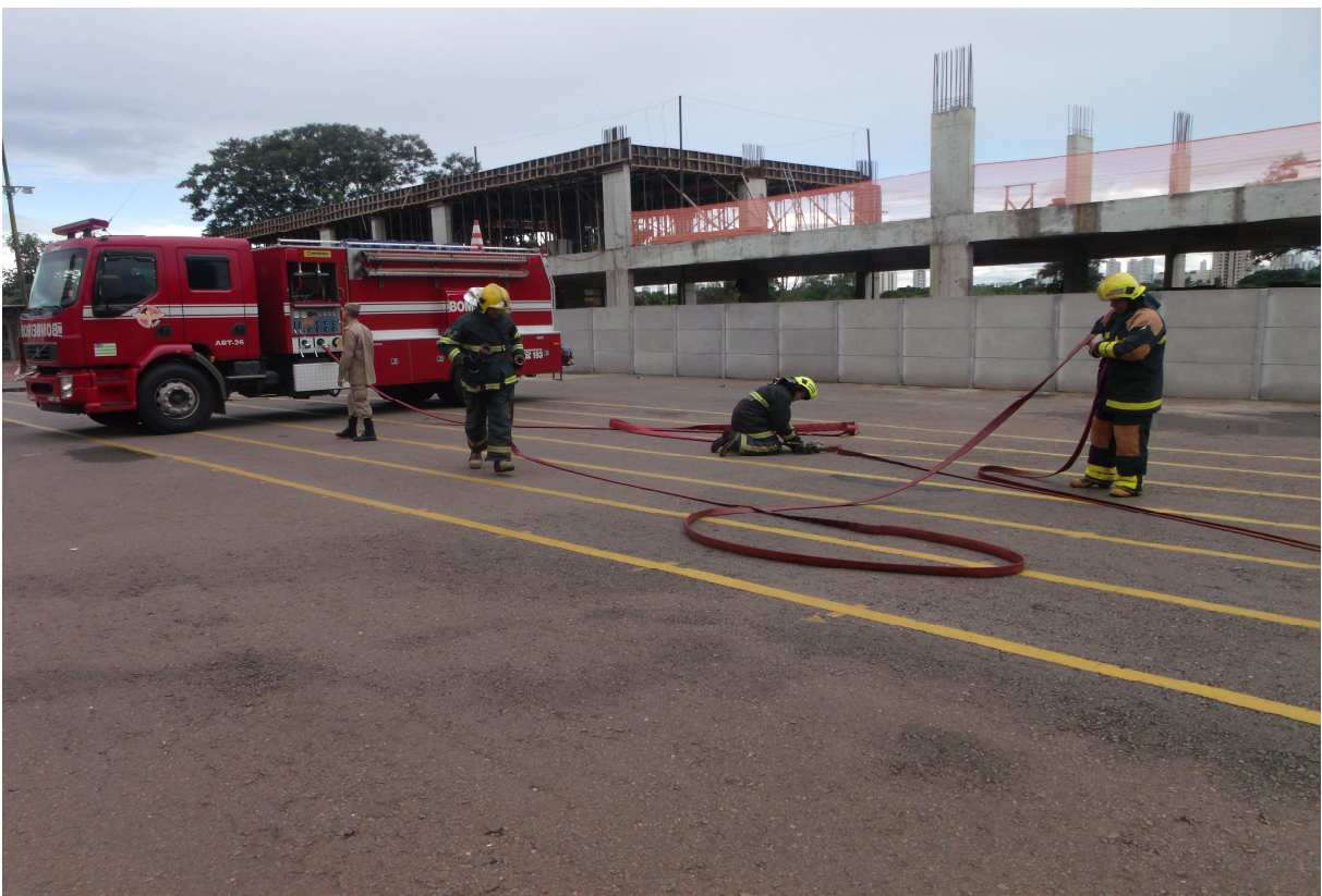
Imagem 6 - Guarnição na montagem da linha de combate