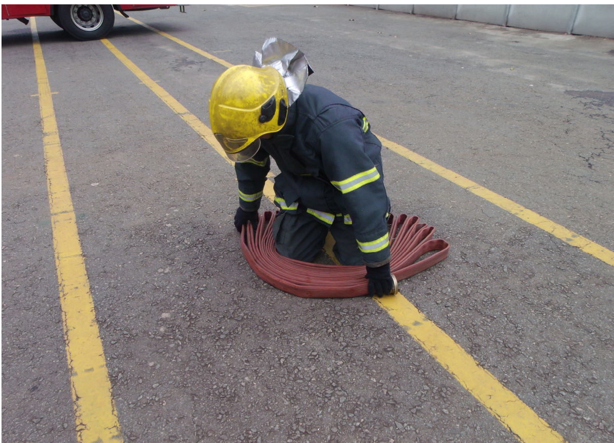
Imagem 14 - Militares acondicionando mangueira em ziguezague