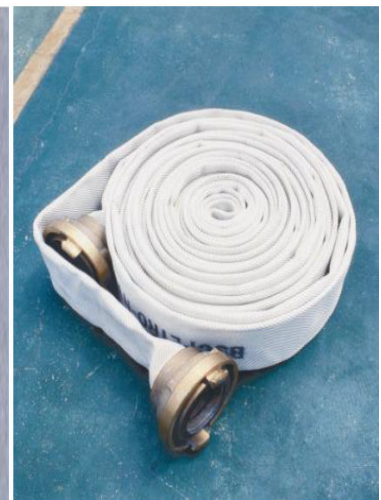
Imagem 11 - Aduchada

Assim, quando estão aduchadas ou acondicionadas em espiral, as mangueiras podem ser transportadas de duas formas, embaixo dos braços, sendo apoiadas pelas mãos e pressionando-as contra o corpo para maior firmeza, com as mãos segurando sua junta externa para que não balancem e também sobre os ombros, sendo recomendado estarem em pé com sua junta de união voltada para frente e junto ao peitoral do combatente (CORPO DE BOMBEIROS DA POLÍCIA MILITAR DO ESTADO DE SÃO PAULO, 2006a).