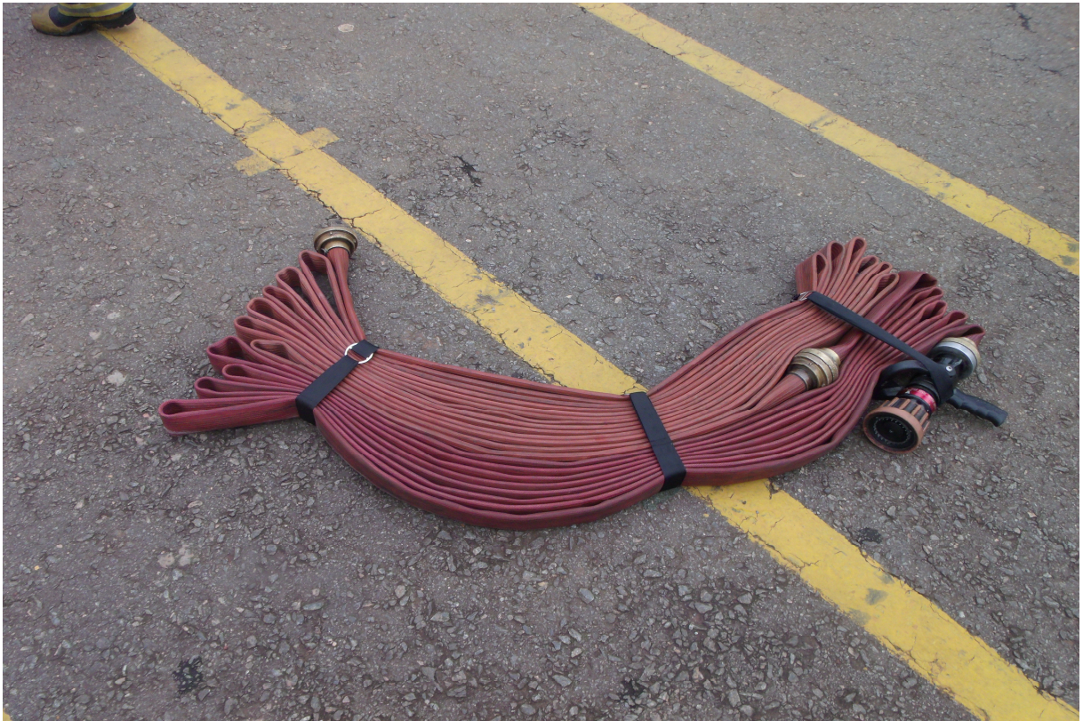
Imagem 11 - Linha pré-montada acondicionada em ziguezague