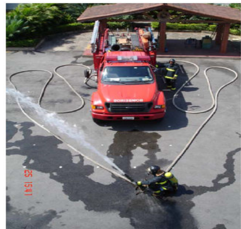
Imagem 14 - Linha siamesa