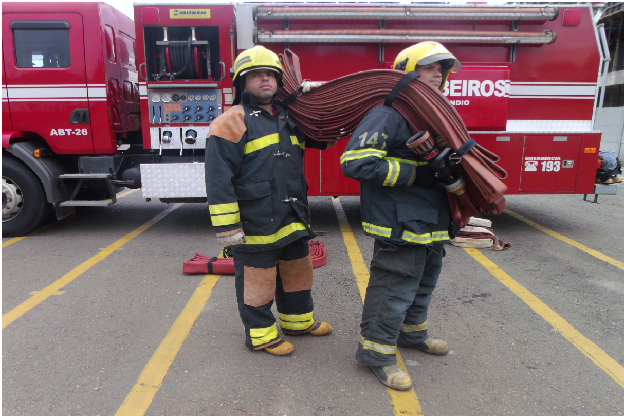
Imagem 13 - Militares transportando linha pré-montada