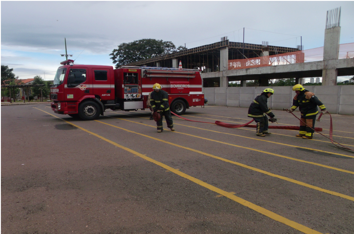
Imagem 5 - Guarnição na montagem da linha de combate com mangueiras aduchadas