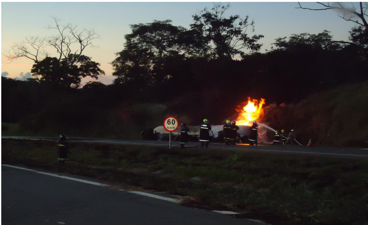
Figura 1 – Atendimento a emergência de GLP na BR-153