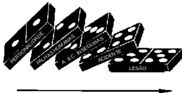
Figura 2 – Teoria do dominó de Heinrich