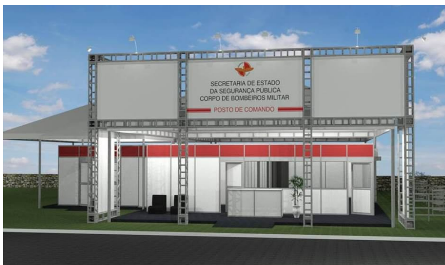
Figura 01 – Fachada do Posto de Comando na cidade de Aruanã