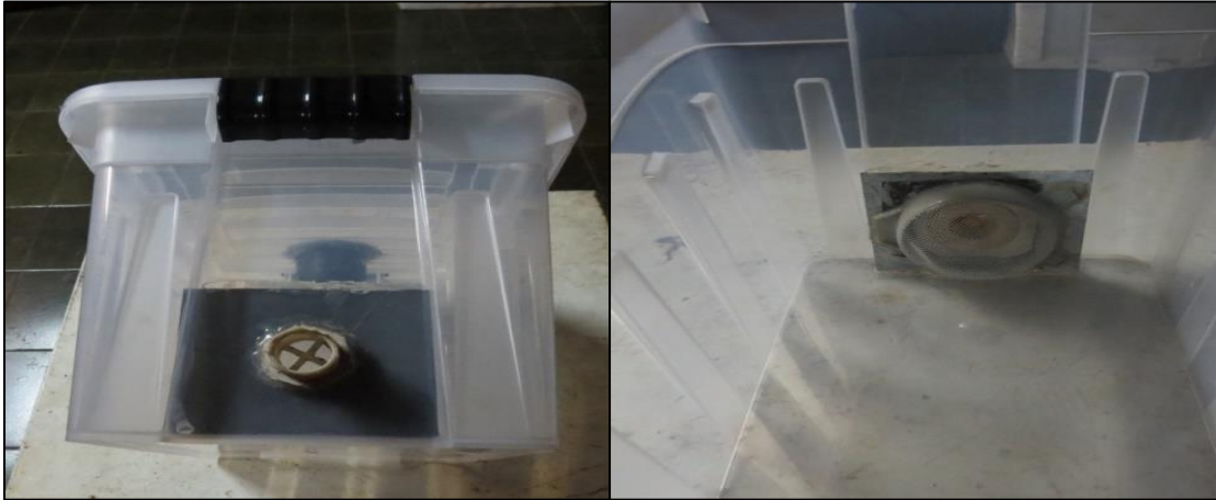
Figura 7 – Tela de proteção e bocal branco fixado com pistola de cola quente.