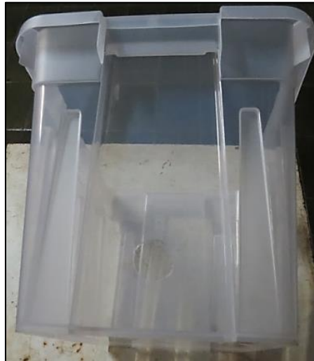
Figura 5 – Abertura realizada na face mais estreita da caixa coletora.