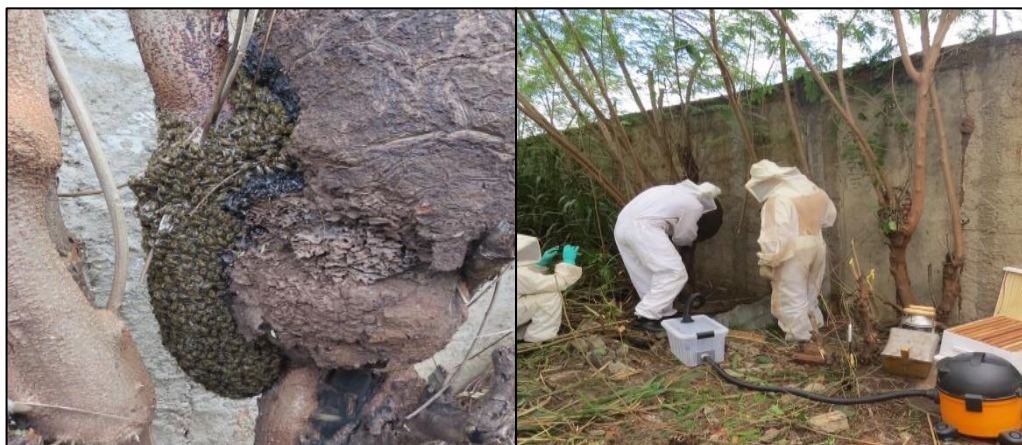
Figura 10 – A Colmeia e o dispositivo adaptado em operação.

Durante o processo foram realizados todos os preparos da captura convencional, como o uso dos EPIs necessários e do fumigador, após a captura do enxame ele foi levado ao apiário da Universidade Federal de Goiás, onde foi doado a instituição. O transporte foi realizado pelos técnicos da prefeitura de Goiânia que possuem um veículo especial de transporte de enxames.