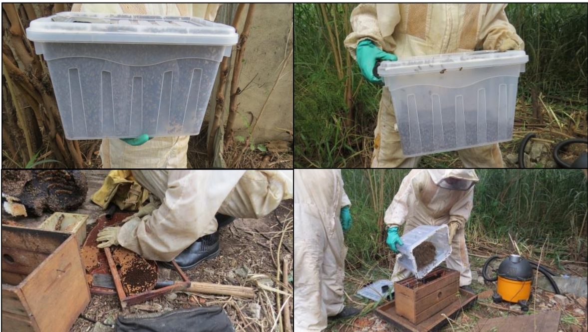
Figura 11 – Armazenagem das abelhas na caixa coletora; preparo e transferência para recipiente de transporte.

Foram utilizadas equipamentos de fotografia e filmagem para registro e coleta dos dados durante a ocorrência.