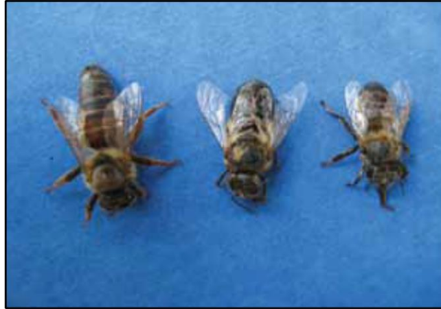
Figura 2 - Abelha Rainha, Zangão e Operária.

Os indivíduos machos de uma sociedade de abelhas melíferas são os zangões, não apresentam estrutura específica para o trabalho e a sua função consiste especificamente em fecundar a rainha e são altamente especializados para reprodução. Possui seus órgãos ausentes ou atrofiados para o trabalho (SENAR, 2010).