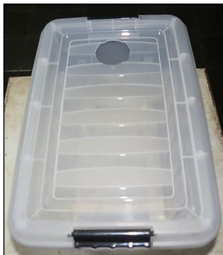
Figura 6 – Abertura realizada na tampa da caixa coletora.