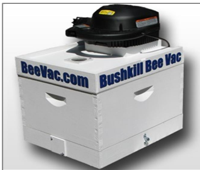
Figura 3 - Dispositivo de captura de abelhas fabricado pela Bushkill Ventures ..

A americana Bushkill Ventures LLC , uma empresa especializada em produtos e serviços de apicultura, desenvolveu um projeto visando à captura de abelhas por meio de sucção segura. A peça principal desse sistema é o seu aspirador, sendo esse responsável por criar as condições necessárias e adequadas de sucção das abelhas, através de um tubo até o interior da caixa coletora, onde elas ficam aguardando o desfecho das ações de captura. O equipamento foi batizado de Bee Vac , e busca atender principalmente o mercado de apicultores dos EUA.