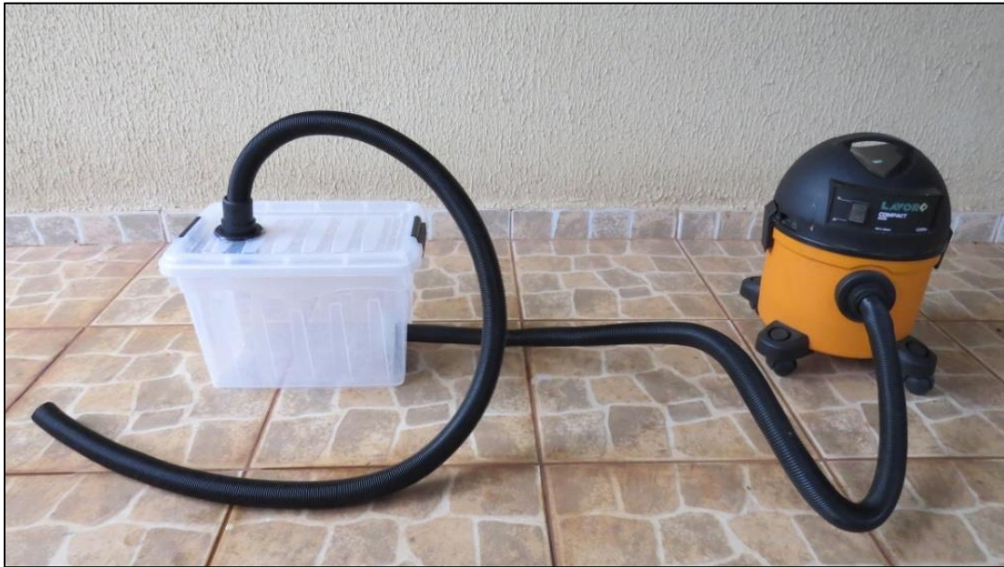
Figura 9 – Dispositivo após as adaptações. (Fonte: Do autor).