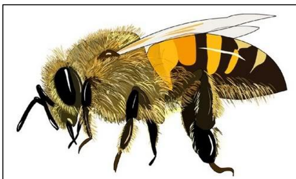
Figura 1 - Abelha Africanizada.

Na maioria das vezes formam suas colônias próximas a áreas populosas, construindo ninhos entre forros e telhados, paredes duplas de residências, ou qualquer outra cavidade que possa abrigá-las e quando perturbadas, sua colônia pode ficar por até 24 horas agitada, continuando o comportamento de defesa. (SANTOS, 2008).