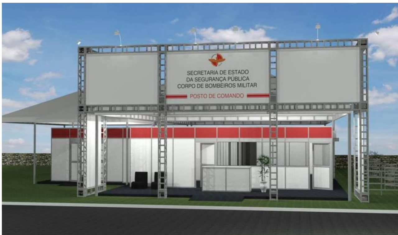
Figura 01 – Fachada do Posto de Comando na cidade de Aruanã.