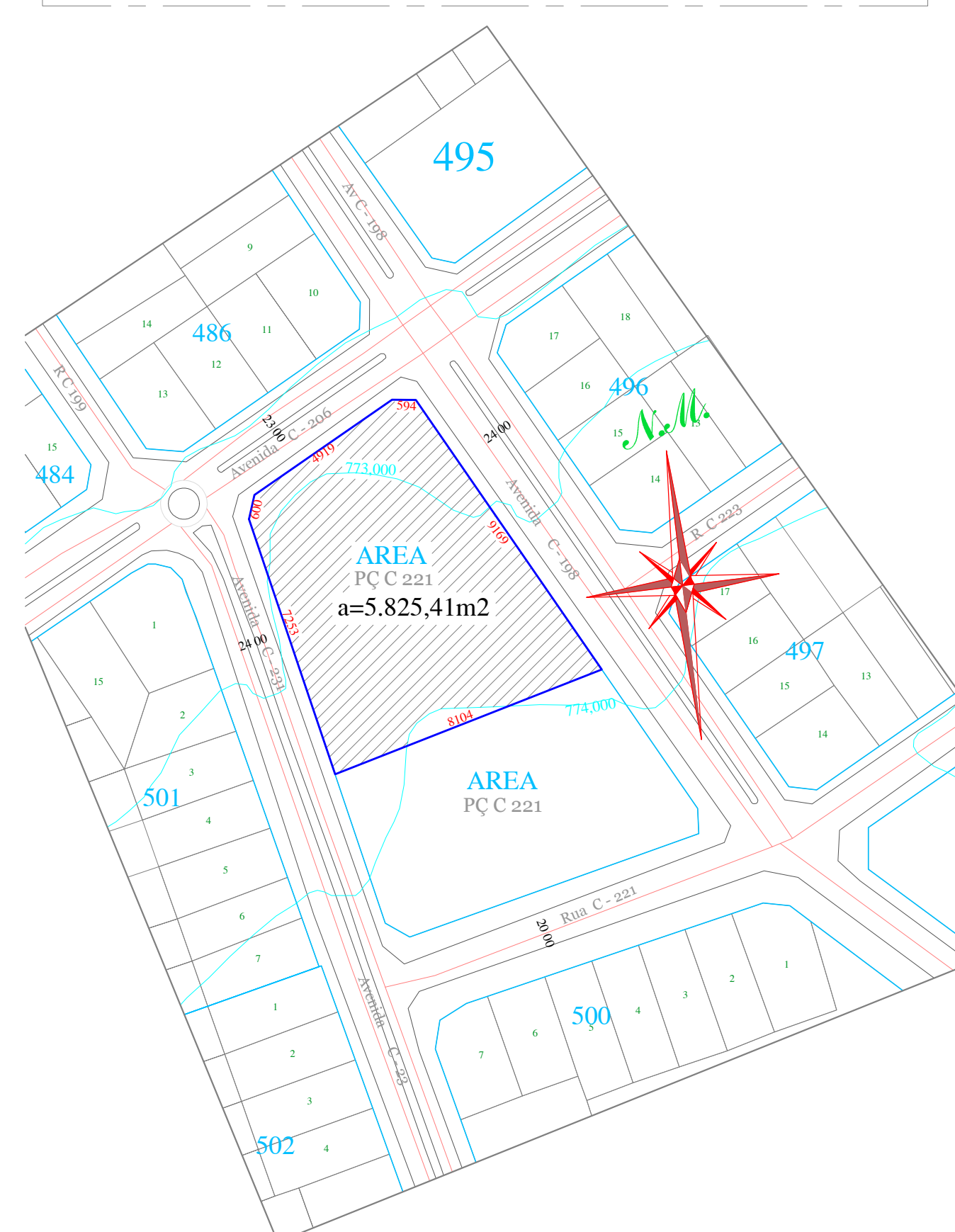
PLANTA DE SITUAÇÃO

NOTA: "O PROJETO ATENDE ÀS REGRAS PREVISTAS NAS NORMAS TÉCNICAS DE ACESSIBILIDADE DA ABNT, DA LEI 7.405 DE NOV/1985 E DO DECRETO 5.296 DE DEZ/2004".