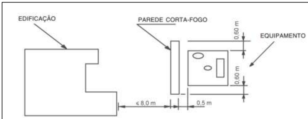
Figura 2 – Separação por parede corta-fogo