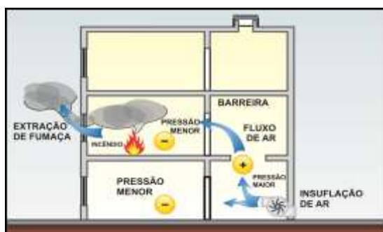
Figura 3 – Diferencial de Pressão

4.1.3 O controle de fumaça é obtido pela introdução de ar limpo e pela extração de fumaça, pelos seguintes tipos de sistemas, conforme Tabela 1.