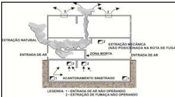
Figura 2 – Zonas mortas