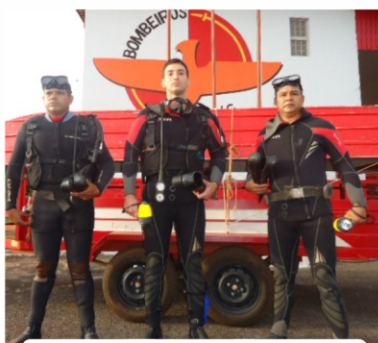
Equipe empenhada no salvamento no Rio Verdão

Para auxiliar as buscas, foram enviados ao local mergulhadores e a guarnição do Helicóptero Bombeiro 01. No domingo, dia 4, o corpo da vítima que estava desaparecida, uma mulher de 42 anos, foi encontrado a 10 quilômetros de distância do local do acidente. Com o apoio aéreo, foi possível avistar a localização da vítima. O Helicóptero Bombeiro 01 pousou nas margens do rio para realizar o resgate, quando um tripulante e um mergulhador completaram a operação com êxito.