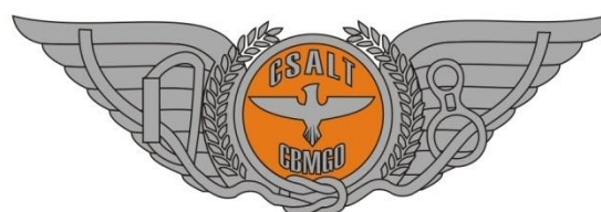
■ Metal Prateado ■ Pantone 152 C