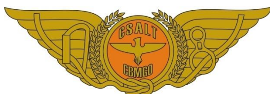
■ Metal Dourado ■ Pantone 152 C

– Para os demais uniformes, o distintivo metálico é dourado para Oficiais e prateado para Praças, conforme especificações: