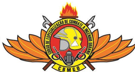
Praças (capacete amarelo)