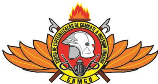
Oficiais (capacete branco)

– Para o uso com gandola, será confeccionado em tecido ou material flexível (plastificado em cloreto de polivinil – PVC) conforme especificações: