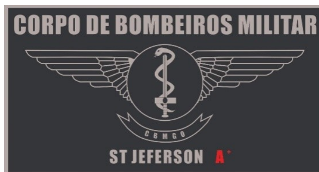
Prateada para Médico Praça

d) Tarjeta com símbolo representativo da função de Enfermeiro - Oficial e Praça - do Serviço Aeromédico: