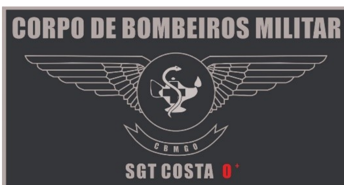
Prateada para Enfermeiro Praça

e) Tarjeta de identificação dos Mecânicos de aeronaves de Segurança Pública: