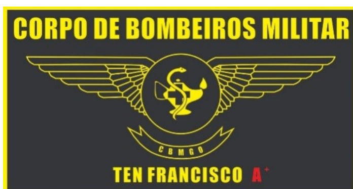
Dourada para Enfermeiro Oficial

d) Tarjeta com símbolo representativo da função de Enfermeiro - Oficial e Praça - do Serviço Aeromédico: