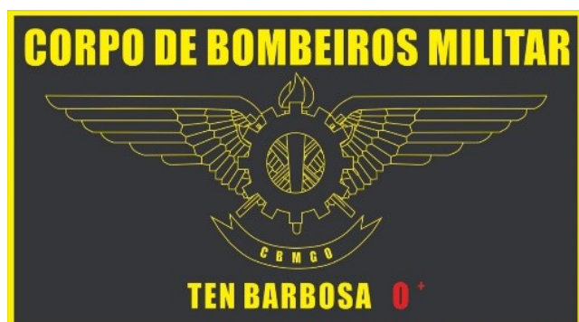
Dourada para Mecânico Oficial

e) Tarjeta de identificação dos Mecânicos de aeronaves de Segurança Pública: