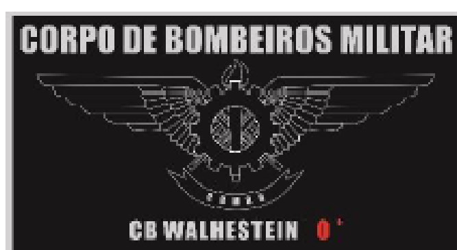
Prateada para Mecânico Praça

- O macacão de voo será utilizado ordinariamente com Gorro Vermelho com Pala, excetuando-se os casos em que as condições de segurança inviabilizem o seu emprego.