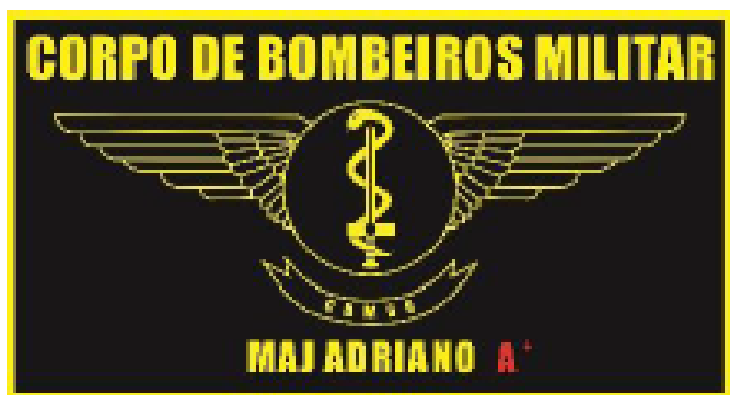
Dourada para Médico Oficial